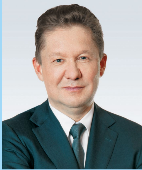
А. Б. МИЛЛЕР, Председатель Правления ПАО «Газпром»