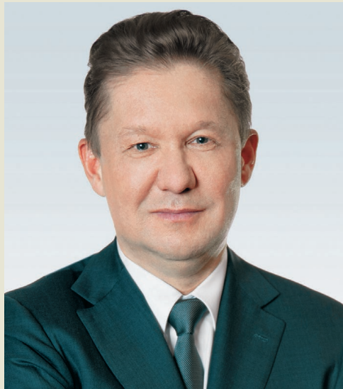
А.Б. МИЛЛЕР, Председатель Правления ПАО «Газпром»